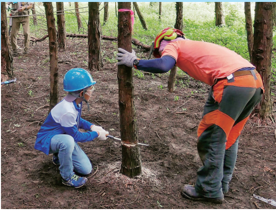
写真(上)：2019年の王子マテリア富士校での間伐体験。写真(下)：2022年のオンラインプログラムでの紙のリサイクル編・手すきはがき(左)と、森のリサイクル編・木製キーホルダー(右)。